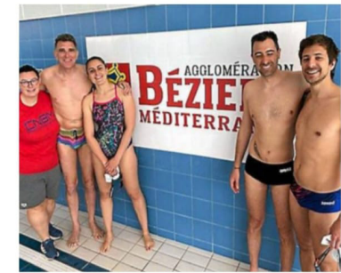
La délégation biterroise sera ambitieuse au Puy-en-Velay.