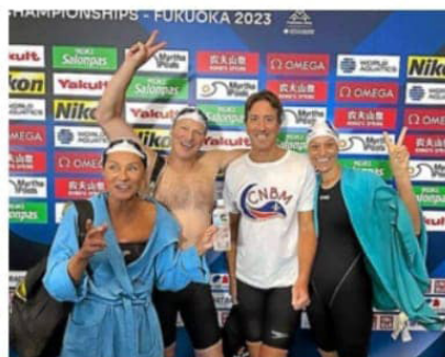
La délégation biterroise a décroché de bons résultats au Japon.