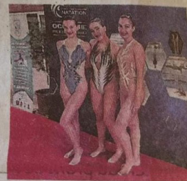
La délégation biterroise.

tique nous a permis de tenir. C'est grâce à l'abnégation de tous que ces médailles ont été rendues possibles. Un grand merci à nos nageuses qui ont su s'adapter à la situation, aux bénévoles qui ont œuvré pour poursuivre la discipline, aux parents pour leur confiance, ainsi qu'à nos trois entraîneurs pour leur travail. Vive la natation artistique ! »