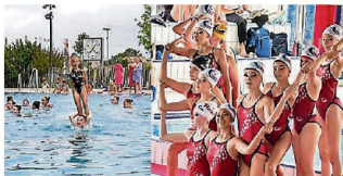
La section natation artistique regroupe 50 nageuses.

Les prochaines échéances se préparent activement pour la section natation artistique, avec plusieurs compétitions prévues en mai et juin. Le public pourra également découvrir la discipline lors du gala du club, le 20 juin à