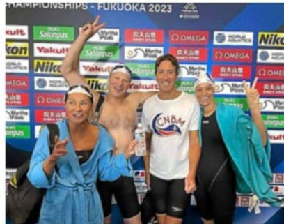
La délégation biterroise a décroché de bons résultats au Japon.