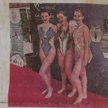
La délégation biterroise.

tique nous a permis de tenir. C'est grâce à l'abnégation de tous que ces médailles ont été rendues possibles. Un grand merci à nos nageuses qui ont su s'adapter à la situation, aux bénévoles qui ont œuvré pour poursuivre la discipline, aux parents pour leur confiance, ainsi qu'à nos trois entraîneurs pour leur travail. Vive la natation artistique ! »