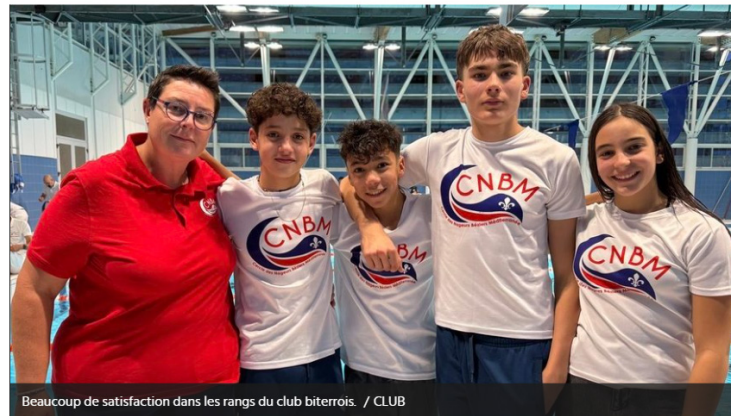
Beaucoup de satisfaction dans les rangs du club biterrois. / CLUB