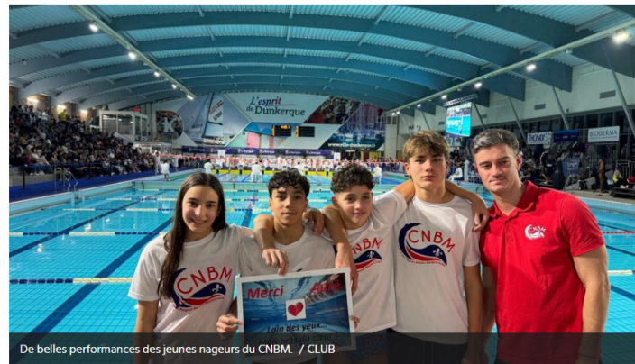
De belles performances des jeunes nageurs du CNBM. / CLUB

Béziers : les jeunes du CNBM terminent bien l'année, les