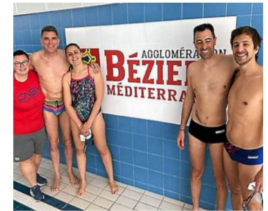
La délégation biterroise sera ambitieuse au Puy-en-Velay.