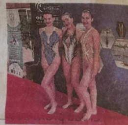
La délégation biterroise.

tique nous a permis de tenir. C'est grâce à l'abnégation de tous que ces médailles ont été rendues possibles. Un grand merci à nos nageuses qui ont su s'adapter à la situation, aux bénévoles qui ont œuvré pour poursuivre la discipline, aux parents pour leur confiance, ainsi qu'à nos trois entraîneurs pour leur travail. Vive la natation artistique ! »