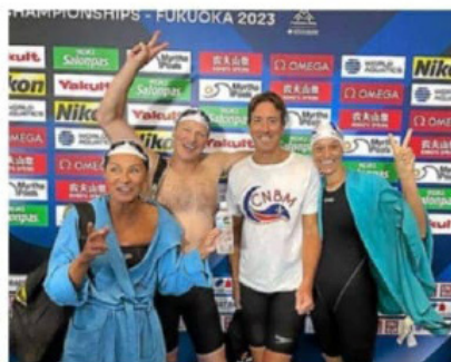
La délégation biterroise a décroché de bons résultats au Japon.