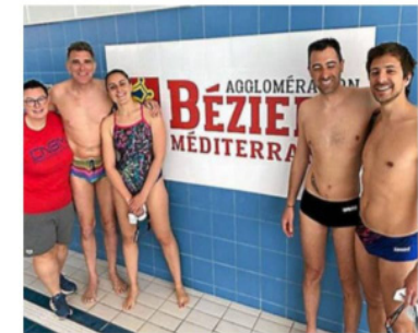
La délégation biterroise sera ambitieuse au Puy-en-Velay.